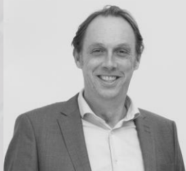
Wouter Muller Makelaar-Taxateur o.g.